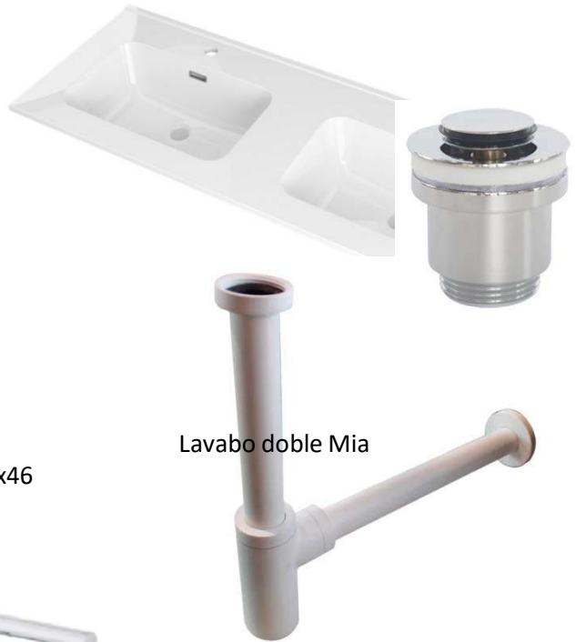
Lavabo doble Mia