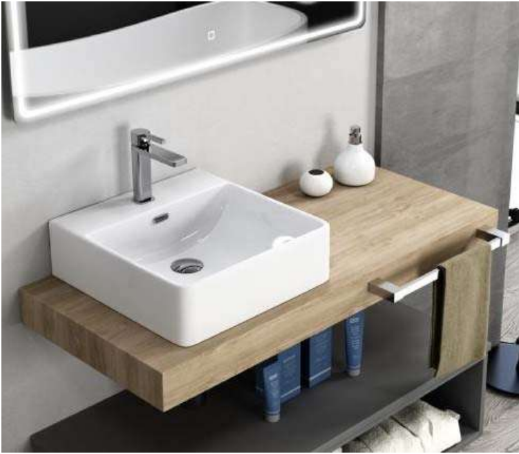
Encimera de madera (modelo similar al de la fotografía)