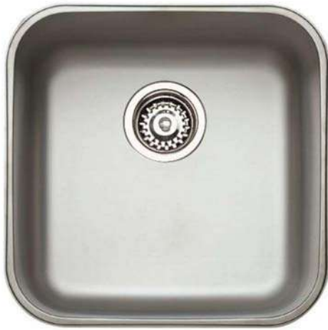
Fregadero New Lisboa