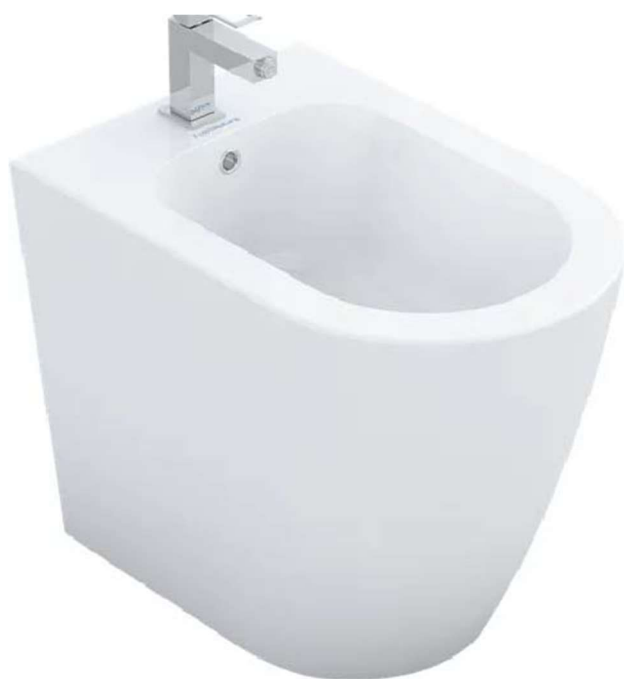
Bidé - Modelo Sensea Nápoles