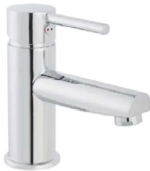
Grifería Lavabo baño principal: Hilo