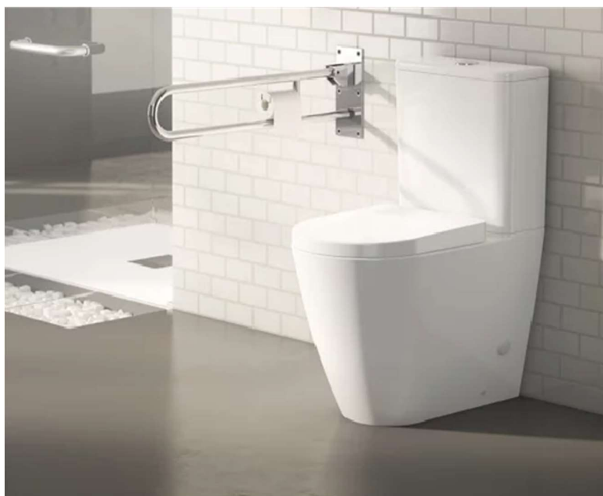
Inodoro - Modelo Sensea Nápoles