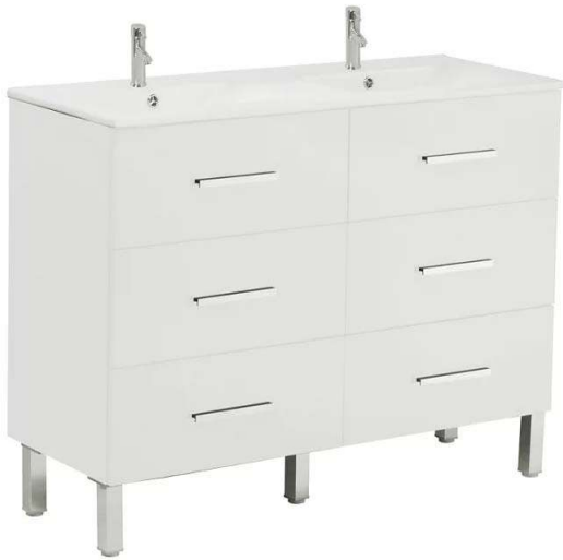
Mueble Madrid blanco 160x45 160x15x46