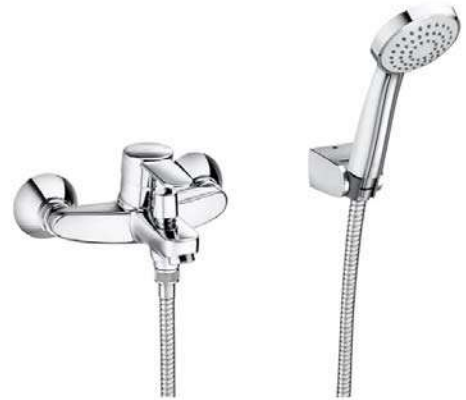
Grifería Bañera mod. Roca MITOS