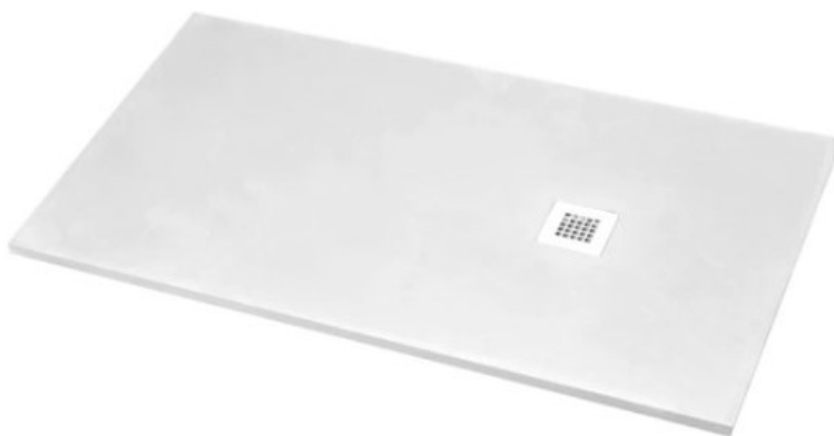
Plato de ducha modelo Legacy 160x80