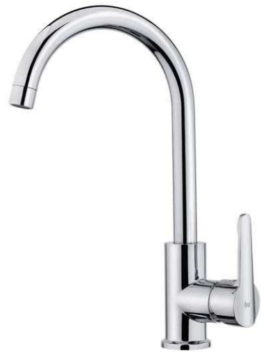
Grifería ML 915 Teka