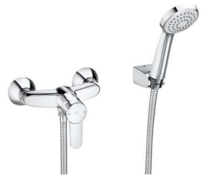
Grifería Ducha mod. Roca MITOS