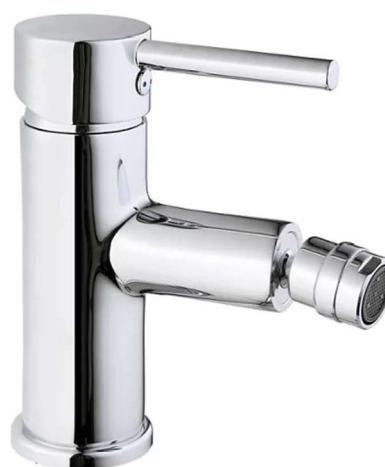
Grifería Bidé: Hilo