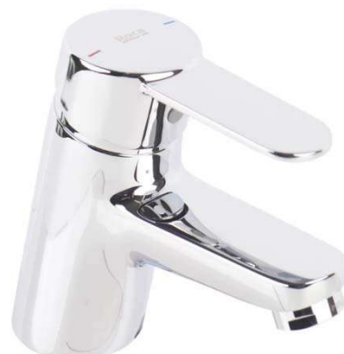
Grifería modelo Roca MITOS