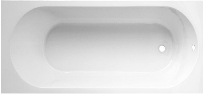
Bañera modelo Nerea 160x70